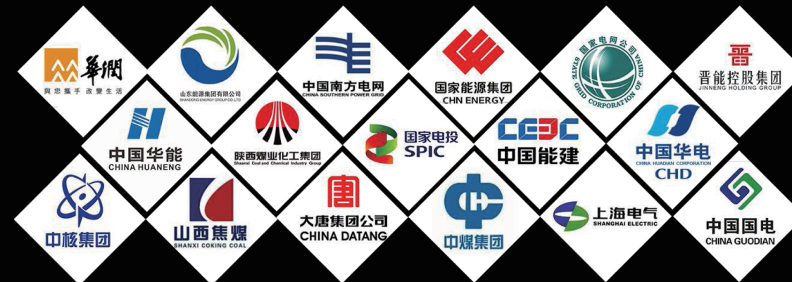
Краткий обзор текущих клиентов и партнеров

Мобильный телефон: +86 15003875985 Имейл: aliceyu@gltech.cn / yinzhang@gltech.cn